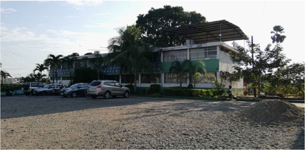
FOTO 1 Vista Fachada Frontal