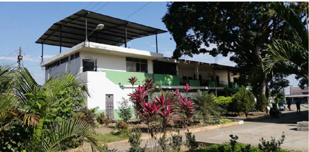
FOTO 2 Vista Fachada Posterior