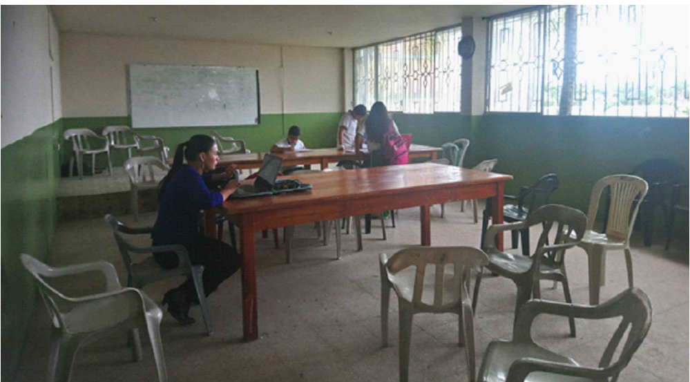
FOTO 3 Vista Interior aula